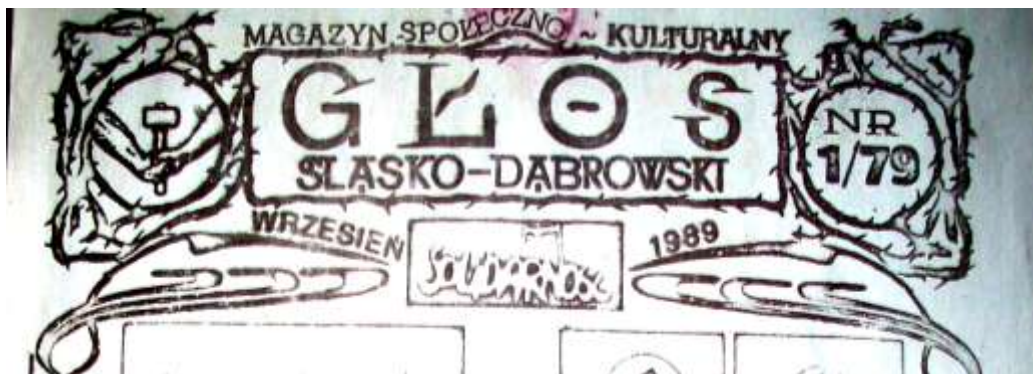
Winieta numeru 1 czasopisma Głos Śląsko-Dąbrowski z września 1989 r.