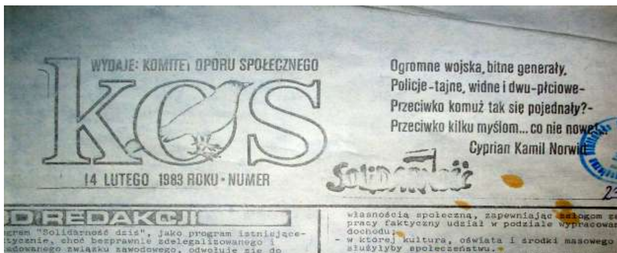
Winieta czasopisma KOS z 14 lutego 1983 r.

Ogromne wojska, bitne generały, Policje tajne, widne i dwu-płciowe. Przeciwko komuż tak się pojednały? Przeciwko kilku myślom... co nie nowe!