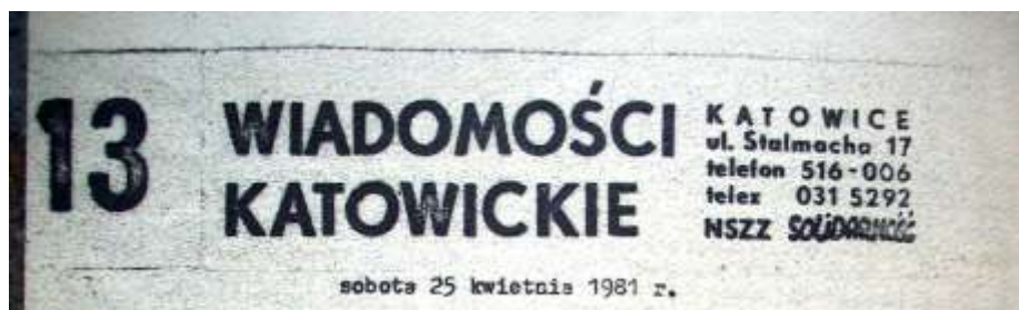
Winieta numeru 13 czasopisma Wiadomości Katowickie z 25 kwietnia 1981 r.