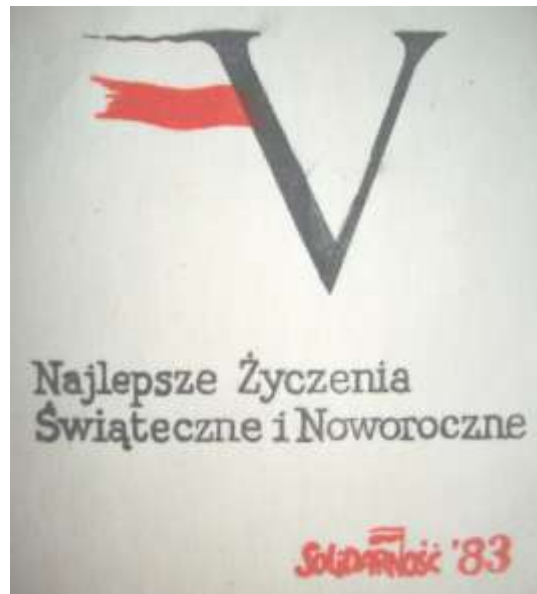
Fotokopia kartki-cegiełki Najlepsze życzenia świąteczne i noworoczne „Solidarność” ‘83.

I na koniec jeszcze jeden druk, a właściwie jego odpis, autorstwa Komitetu ds. Związków Zawodowych Urzędu Rady Ministrów z 1982 r. pt. Wytyczne dla komisarzy wojewódzkich , dotyczący sposobu szkalowania i represjonowania członków NSZZ „Solidarność” oraz chętnych do wstąpienia do tego związku, natomiast „nagradzania” wstępujących do „rządowych” związków (tworzonych na podstawie Uchwały Sejmu o związkach zawodowych z października 1982 r. – przyp. aut.), zawierający także wskazówki odnośnie propagandy antykościelnej.