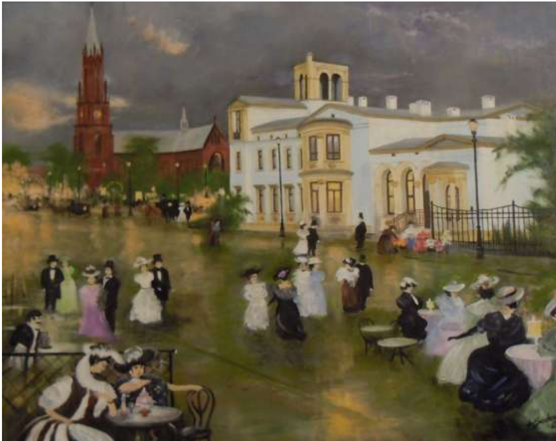
Fotokopia obrazu Willa Fitznera w Siemianowicach Śląskich , autorstwa A. Sadowskiego.