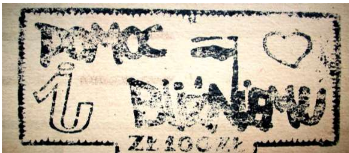
Fotokopia kartki-cegiełki Pomoc bliźniemu .

Wśród pism solidarnościowych przekazanych Czytelni PBW w Katowicach znalazły się także 2 kartki-cegiełki: Pomoc bliźniemu o wartości ówczesnych 100 zł oraz Najlepsze życzenia świąteczne i noworoczne „Solidarność” `83 – na pomoc dla represjonowanych.