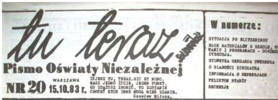
Winieta numeru 20 czasopisma Tu, Teraz z 15 października 1983 r.