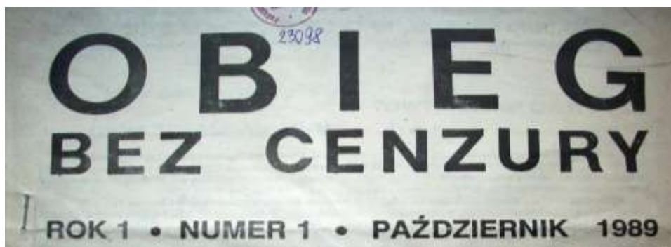
Winieta numeru 1 czasopisma Obieg Bez Cenzury z października 1989 r.

Pismo redagowane było przez ludzi związanych z niezależnym ruchem wydawniczym, skierowane głównie do Klubów Książki Nieocenzurowanej. Jego celem było zapewnienie kontaktu wydawców niezależnych z czytelnikami, poznawanie ich potrzeb, postulatów i ocen. Publikowano w nim recenzje, zapowiedzi wydawnicze rynku niezależnego, informacje o bestsellerach na rynkach światowych, porady prawne dla osób pragnących rozwijać inicjatywy wydawnicze. Pismo nie służyło żadnemu określonymu kierunkowi politycznemu lecz wspierało różnorodny pomysł, zwłaszcza niekonwencjonalne i oparte na zasadach intelektualnej i gospodarczej konkurencji [15].