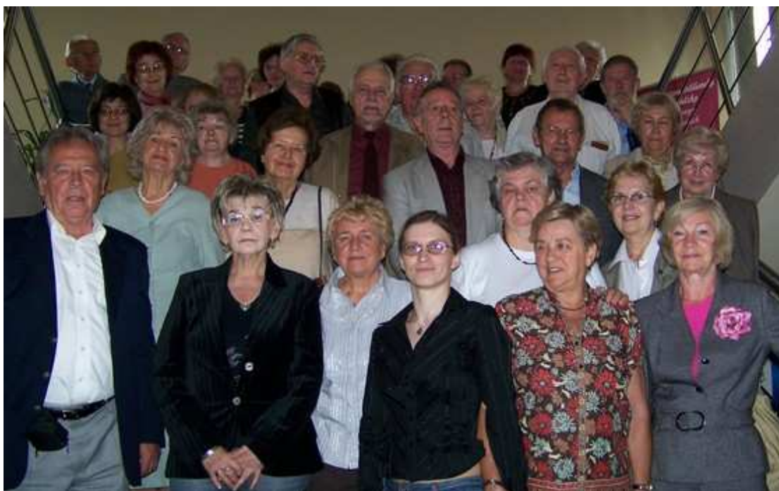
Zakończenie zajęć - semestr letni 2007/2008